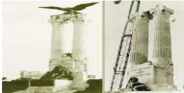
Derribo del Águila del Monumento al Maine el 1º de mayo de 1961, tras la derrota de Bahía de Cochinos

el 1º de mayo de 1961, apenas días después de la derrota de la Brigada de Asalto 2506 en Playa Giron el 19 de abril de 1961, en un acto de masas rebotante de populismo revolucionario - el cual