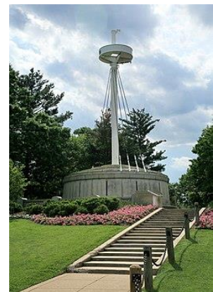
Monumento al USS Maine en el Cementerio Nacional de Arlington en Virginia.

La tragedia del Maine permaneció entre los misterios olvidados de la historia hasta que el Almirante Hyman G. Rickover intrigado por el desastre, comenzó una investigación privada en 1974 que concluiría dos años más tarde con la publicación del llamado “ Informe Rickover Sobre el USS Maine ”. El almirante, conocido como el precursor de la propulsión nuclear en la Armada norteamericana, utilizó información de las dos comisiones oficiales anteriores, de los reportes de prensa, la documentación oficial y los datos sobre la construcción del acorazado y las municiones abordo del Maine , llegando a la conclusión que la explosión no estuvo causada por una mina. En su lugar, se especuló sobre el inicio de una auto combustión en el depósito principal de carbón del Maine que al calentar el mamparo que lo separaba de los paños de proyectiles de 10 pulgadas de las armas principales del buque, estas explotaron a causa del calor transmitido por el incendio en el depósito carbonífero. Otra posibilidad propuesta fue la explosión espontanea de una nueva clase de pólvora usada en los cañones pesados del buque, lo que ya había sucedido previamente en otras unidades de la Armada norteamericana debido a la impericia de su manejo por el personal de marinería.