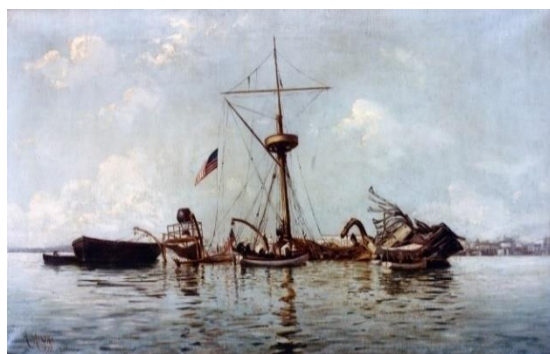
Restos del USS Maine en la Bahía de La Habana

participar en ella, lo cual fue rechazado por Washington. Esta primera revisión de los hechos que se vio afectada por la necesaria corrección diplomática y el deseo español de evitar un enfrentamiento con los Estados Unidos, llegó a la conclusión que la explosión se originó en el interior del buque. Por su parte, la investigación