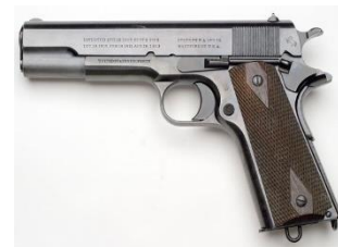
Pistola Colt 45 ACP