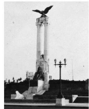
Monumento al Maine en La Habana en 1925.

El USS Maine no sería olvidado por los norteamericanos pues en varias ciudades e instituciones de Estados Unidos existen monumentos y mausoleos elegidos en reconocimiento al sacrificio a sus 266 mártires, quienes ofrendaron su vida al servicio de su país. Aparte del monumento mortuario en el Cementerio Nacional de Arlington, existen recordatorios al Maine en el Parque Central de Nueva York, en el Cementerio de Cayo Hueso, en la Academia Naval de Annapolis y en 14 otras ciudades y localidades en los Estados Unidos. Pero quizás el monolito más famoso en remembranza al USS Maine y su tripulación - y el que más notoriedad y cambios ha tenido a través de los años - se encuentra en el habanero Paseo del Malecón. Ese monumento, inaugurado en 1925 por el cuarto Presidente constitucional de Cuba, Alfredo Zayas, como homenaje del pueblo cubano a la tripulación del buque siniestrado, estaba