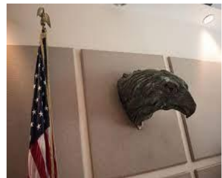
Cabeza del Águila del Monumento al Main en la Sección de Intereses de Estados Unidos en La Habana.

El águila de bronce que coronaba el monumento desde 1926 fue arrojada desde su dintel y su cuerpo con sus alas rotas fueron almacenadas en el Museo de la Ciudad de La Habana, mientras que la cabeza fue expuesta en la Sección de Intereses de Estados Unidos en La Habana, hoy elevada a la categoría de Embajada. Cabe reseñar que el encargado de la Oficina de Intereses de Estados Unidos en Cuba, Wayne Smith, declaró en 1977 con relación al águila derribada de su pedestal en mayo de 1961 que “Hasta que no se reúna el cuerpo y la cabeza (del águila) no habrá relaciones buenas entre Cuba y los Estados Unidos” .