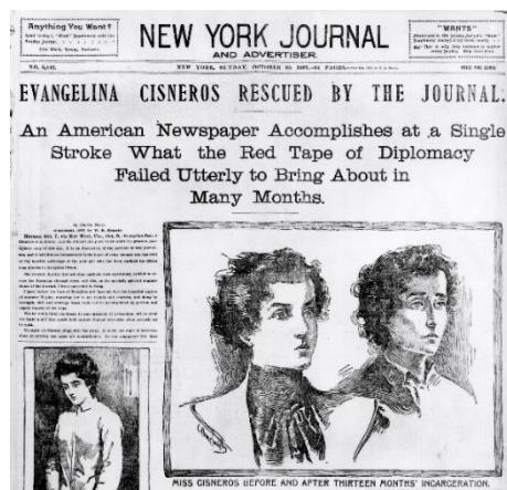
Portada del New York Journal