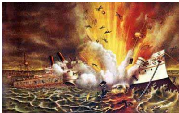
Destrucción del USS Maine

explosión lanzó por los aires los cuerpos desmembrados de los marineros, creando un estado de pánico en la ciudad. De inmediato las embarcaciones que se encontraban en las cercanías del Maine - entre ellas el buque norteamericano Saratoga y el español Alfonzo XII - se movilizaron para prestar asistencia. La destrucción del USS Maine generó una gran indignación en la opinión