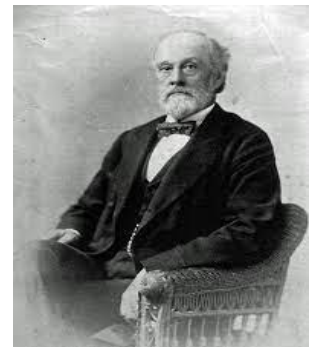
Senador Orville H. Platt

Después de la derrota de España, los Estados Unidos ocuparían Cuba entre 1898 y 1902, ejecutando acciones beneficiosas para la Isla, sobre todo en materia de saneamiento urbano y organización política y educacional. El 20 de mayo de 1902, tal y como lo había decidido el Congreso de los Estados Unidos en la Resolución 233 del 19 de abril de 1898 y en la Enmienda Teller, aprobada por el Senado en la misma fecha, Cuba se constituyó en una Republica libre e independiente. Sin embargo, la independencia no llegó sin condiciones pues en 1901 un desconocido Senador estadounidense por el estado de Connecticut de nombre Orville H. Platt, hizo incluir una enmienda en la Constitución cubana que estaba siendo redactada por la Convención Constitucional instalada el 5 de noviembre de 1900. La Enmienda Platt , como llegó a conocerse este dictatum impuesto a los cubanos, establecía en la practica el derecho de los Estados Unidos a intervenir en Cuba para preservar su independencia y los intereses y propiedades de sus ciudadanos, lo que de hecho convirtió a la Isla en un protectorado de Estados Unidos. Adicionalmente, Cuba quedó obligada a vender o arrendar parte de su territorio a Estados Unidos para el establecimiento de bases navales o carboneras.