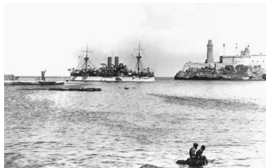
USS Maine arribando a La Habana

Directamente al Castillo del Morro y a la Fortaleza de San Carlos de La Cabaña, las principales fortificaciones que protegían a La Habana. Aquel fatídico 15 de febrero todos los oficiales del Maine - con excepción de dos de ellos que perecieron en el siniestro y del Capitán Sigsbee que se encontraba en su camarote ubicado en la popa del barco - se encontraban en tierra en un baile celebrado en su honor por las autoridades españolas. Para las 21:30 horas se había producido el toque de retiro y los marineros dormían en sus hamacas y algunos de ellos en la cubierta principal del Maine debido al fuerte calor que hacía en los niveles inferiores del buque. A las 21:40 horas una gran explosión destruyó la parte delantera del Maine , produciéndose rápidamente su hundimiento por la popa en las poco profundas aguas de la bahía habanera. La fuerza de la