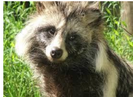
El Perro mapache

ralizó al mundo por más de tres años, destruyendo las economías de países y causando la muerte de más de 7.000.000 de personas. (13) Esta realidad está forzando a quienes desde un principio impusieron la tesis del origen natural del coronavirus SARS-CoV-2, a continuar contradiciendo y desacreditando la posibilidad que la pandemia pudiese tener su origen en una fuga accidental del coronavirus en un laboratorio. Entre aquellos que asumieron la posición única y excluyente sobre el origen natural de la pandemia, están las cadenas televisivas y medios de comunicación de Estados Unidos. Uno de esos medios que impuso a su audiencia la tesis que todo se originó por el contacto entre un mamífero y un humano en un mercado de la ciudad de Wuhan, es la Cadena CNN. En lo que parece un intento de justificar su baldía posición sobre el origen natural del COVID-19, CNN en Español publicó el 18 de marzo de 2023 un artículo de Brenda Goodman en el cual la autora hace alusión a una “ una nueva pista tentadora ” que surge de “ un nuevo análisis ” que descartaría al murciélago, al pangolin y al Ejército de Estados Unidos