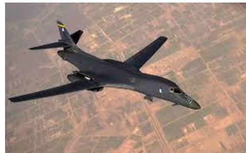
Bombardero B-1B Lancer