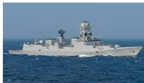
El destructor INS Kolkata

Pero sería al comienzo de marzo de 2024 cuando los ataques por los hutíes cruzaron el umbral de la “línea roja” en la crisis marítima en el Mar Rojo y el golfo de Adén. El miércoles 6 de marzo el buque carguero M/V True Confidence de bandera de Barbados y propiedad norteamericana que navegaba en el Golfo de Adén fue alcanzado por un misil balístico antibuque causando la muerte a 3 de sus tripulantes y heridas graves a otros 6. Veintiún miembros sobrevivientes de la tripulación del True Confidence serían rescatados por el buque de la armada de la India INS Kolkata (10) y llevados a salvo a Djibouti. Un día antes del ataque al carguero