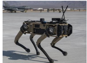
Robodogs israelíes son enviados de cacería a Gaza

El grupo Hamas se ha negado a entregar los más de 120 rehenes israelíes que aún mantienen cautivos en Gaza, lo que de hecho puso fin a las negociaciones para una tregua y alto al fuego que se realizaban en Egipto y sus ataques han continuado, lo que ha llevado a que Israel anuncie que nada detendrá la ocupación de la ciudad sureña de Rafah en Gaza, aun contradiciendo lo advertido por el Presidente Biden contra la ocupación de esa ciudad hacia donde han sido desplazado más de 1.500.000 civiles palestinos. La lucha calle por calle en gaza ha llegado a tales inéditos extremos, que las fuerzas israelíes han desplegado robots conocidos como “Robodogs” para dar caza a los terroristas de Hamas que se esconden en las ruinas y túneles en Gaza.