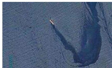
Derrame de petróleo y fertilizante dejado por el M/V Rubymar en el Mar Rojo

seguros, según lo reportó el 7 de marzo de 2024 el Fondo Monetario Internacional en su Blog https://www.imf.org/en/Blogs . Los ataques hutíes también han causado daños a los cables submarinos de datos que conectan a Asia con Europa, reduciéndose en un 25% el tráfico en la Red Seacom por la que discurre el 80% de ese tráfico. El lunes 19 de febrero el buque carguero granelero M/V Rubymar con bandera de Belice y propiedad de una empresa británica que transportaba 41,000 toneladas de fertilizantes, fue alcanzado por uno o más misiles balísticos lanzados desde Yemen. El M/V Rubymar se hundiría a consecuencia de los daños sufridos no sin antes dejar una estela de combustible y fertilizante de más de 30 kilómetros de largo que contaminó seriamente las aguas a su alrededor. Los 24 miembros de la tripulación del buque fueron rescatados por el portacontenedores Lobivia con bandera de Singapur, con apoyo de un navío de guerra de la “Operación Guardián de la Prosperidad”. (9) El carguero Lobivia llevó a los tripulantes del Rubymar sanos y salvos a Yibuti.