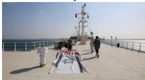
Banderas de Estados Unidos e Israel colocadas en la cubierta del Galaxy Leader para ser pisoteadas por quienes visitan el buque.